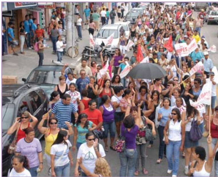
Professoras em luta por melhores condições de trabalho.

no Centro, não foi a única atividade de pautada em comemoração ao 8 de março. Durante todo o domingo, dia 7, o Sintraconst foi palco de um encontro de formação política com mulheres de diversos movimentos e entidades. As discus-